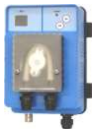
STRUMENTO DI CONTROLLO DEL pH