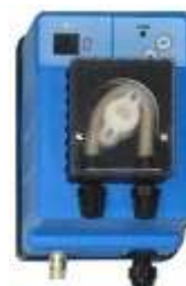
STRUMENTO DI CONTROLLO DEL CLORO TRAMITE IL POTENZIALE REDOX